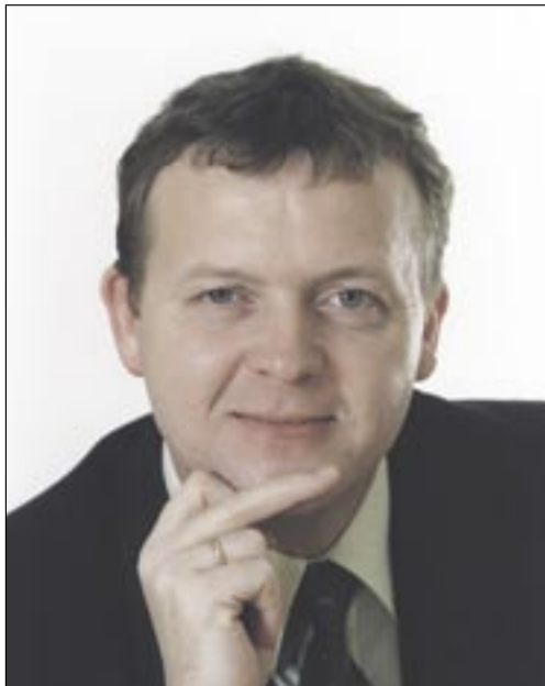
Indenrigs- og sundhedsminister Lars Løkke Rasmussen

De fleste børn og unge er sunde og raske. De trives og er glade - i hvert fald det meste af tiden. De spiser for det meste sundt og bevæger sig meget.